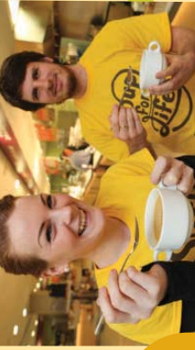
Mic léinn tíreolaíochta in OÉ Gaillimh ag obair go deonach don ócáid 'Soup for Life' eagraithe ag Gorta