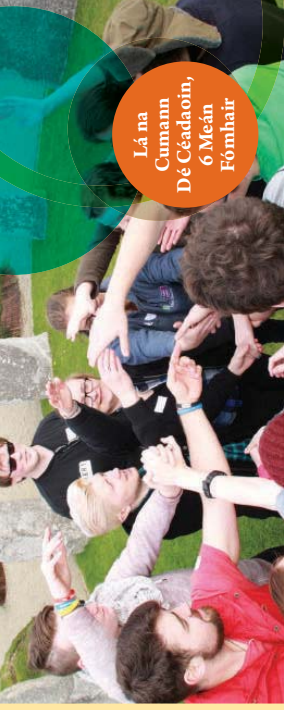
Lá na Cumann Dé Céadaoin, 6 Meán Fómhair

Tá breis is 100 cumann bunaithe san Ollscoil - cumainn shóisialta agus ealaíne dála DramaSoc agus Film Soc, agus cumainn ábharbhunaithe dála an Chumainn Gnó, Francise agus Leighis. I measc na gcumann eile a bhfuil duaiseanna buaite acu tá an Cumann Liteartha agus Diospóireachta, an Cumann Cleasíochta, Lotus agus an Cumann Cóirúil, agus is ann do chumainn eile dála na gCumann FanSci, Disney, Potter & Victoiriach nach bhfuil d'aithm leo ach an chraic agus an spraoi a bhrú chun cinn. Mura bhfuil spéis agat i geann ar bith de na cumainn atá bunaithe cheana féin d'fhéadfá cumann nua a bhunú? Níl uait